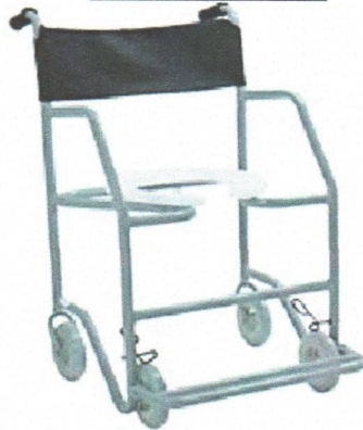
Modelo: Big (Obeso)/ Braço Fixo