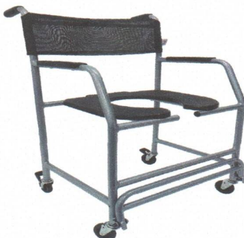
Cadeira de banho big 160 kgs

Estrutura em aço carbono com tratamento anti ferrugem