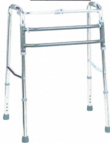
Andador alumínio D10